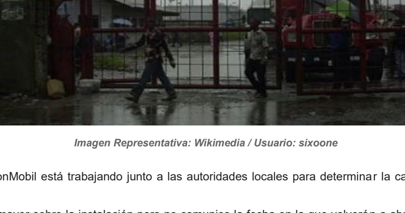
Imagen Representativa: Wikimedia / Usuario: sixoone

El Daily Trust cita a una fuente anónima que dijo que los dos trabajadores incumplieron con procedimientos de seguridad mientras la planta regresaba de un periodo de mantenimiento. La fuente informa que se les había ordenado a los dos trabajadores encender una tea de gas que quema el exceso de gas y suministra energía a una turbina en la instalación que es utilizada para dar energía a la planta.