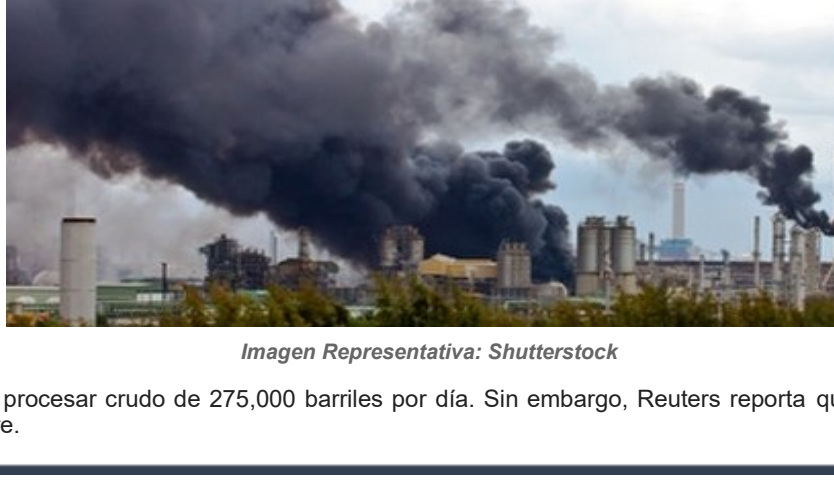
Imagen Representativa: Shutterstock

Los bomberos lucharon contra las llamas durante varias horas antes de lograr extinguirlas. La falta de bocas contra incendios en el área hizo muy difícil el trabajo hasta que llegaron los camiones de bomberos. Los paramédicos atendieron la escena alrededor de las 10:00 hora local, los 13 heridos fueron llevados al hospital.